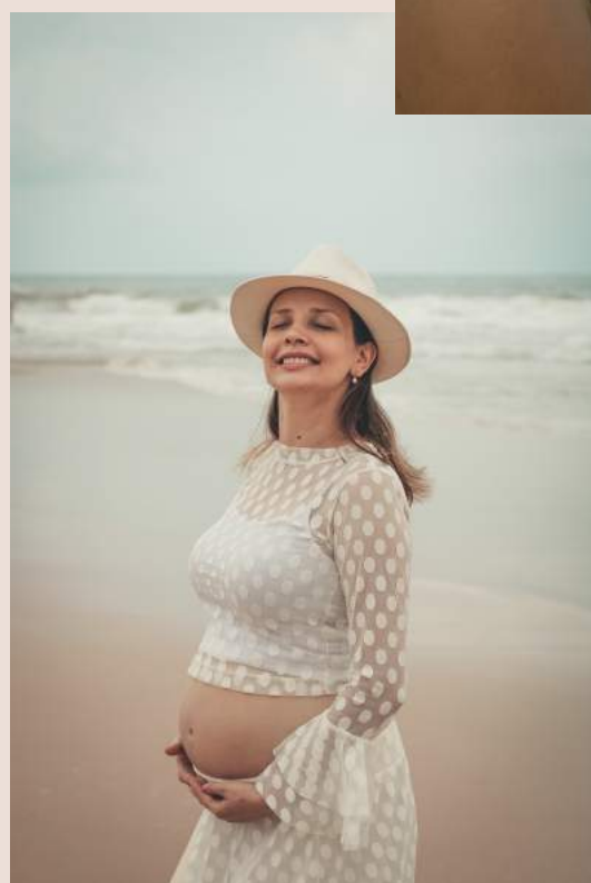
Por Michele Vasconcelos