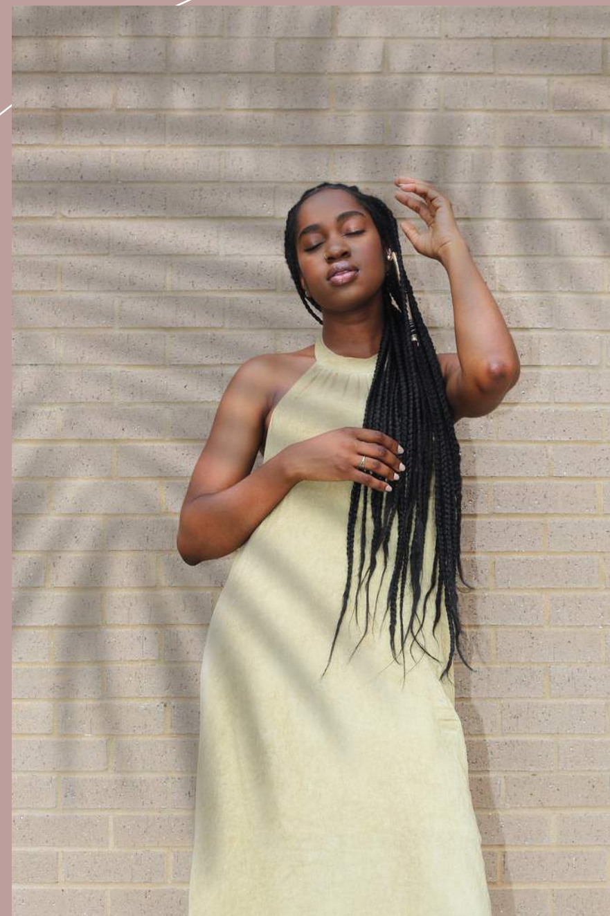
Por Michele Vasconcelos

É o desenvolvimento da identidade da mulher a partir das Escrituras