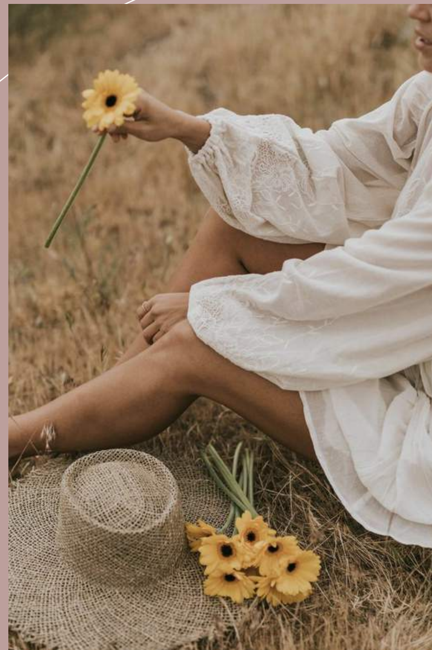
Por Michele Vasconcelos

Como tudo começou? Igualdade e propósitos da Criação da Mulher. Auto estima e a busca por força feminina.