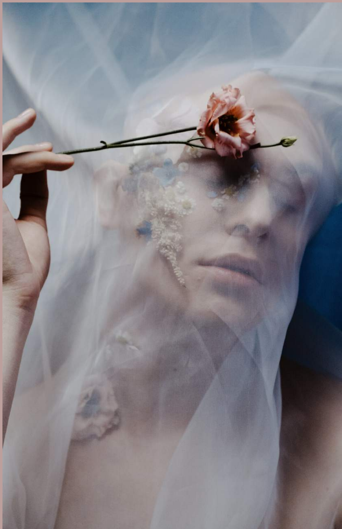
Por Michele Vasconcelos