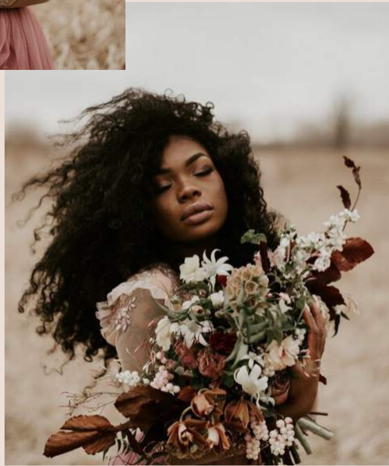
Por Michele Vasconcelos