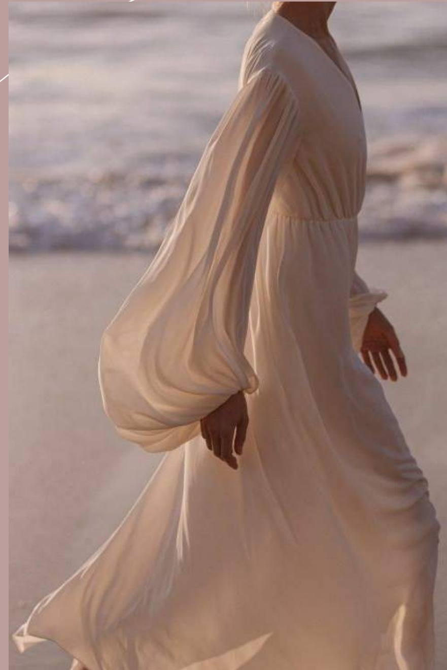
Por Michele Vasconcelos