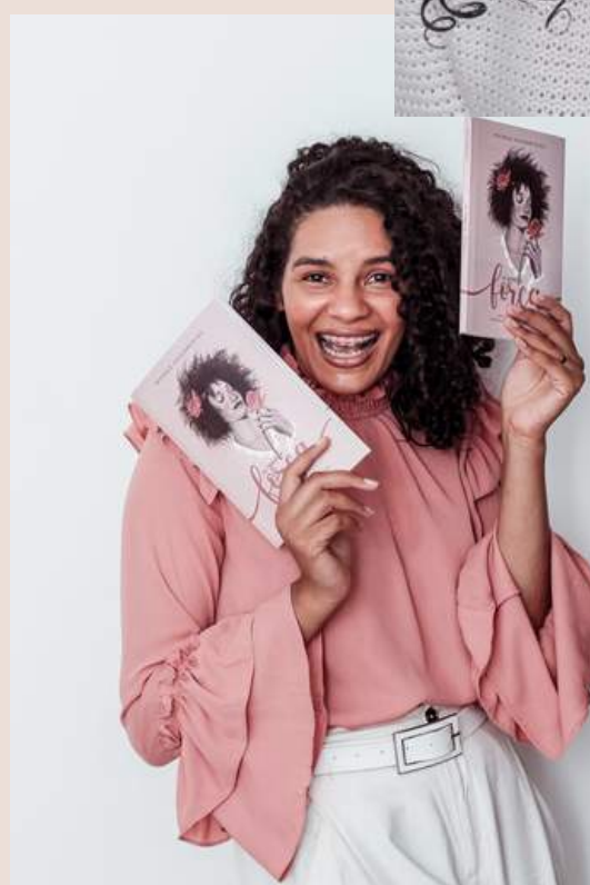
Por Michele Vasconcelos